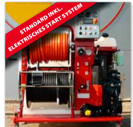
Vorderansicht ROM COMPACT 140/45 Diesel Ausführung (mit anderem Armaturenbrett, Wärmetauscher, Kraftstoff filter u.s.w.)