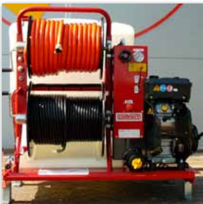
Vorderansicht ROM COMPACT Base 190/30 Benzin Ausführung