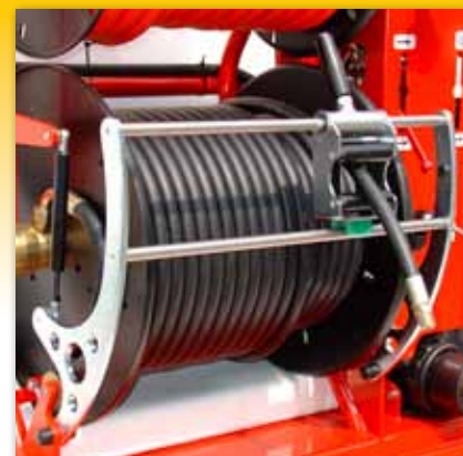
Hydraulisch angetriebene Hochdruckhaspel inkl. ausklappbarer gelagerter Schlauchführung