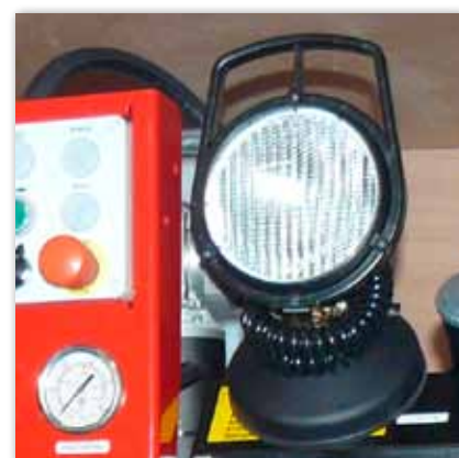
Arbeitslampe mit Magnetfuß versehen