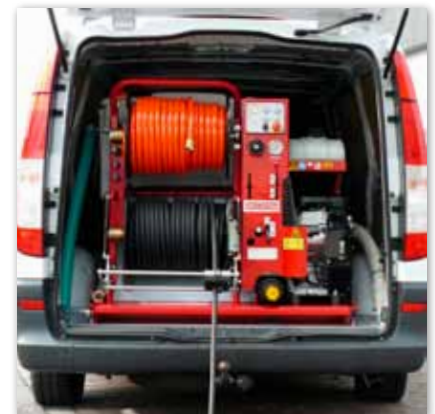
Kompakt und Leichtgewicht, geeignet für leichte bis mittelschwere Firmenwagen