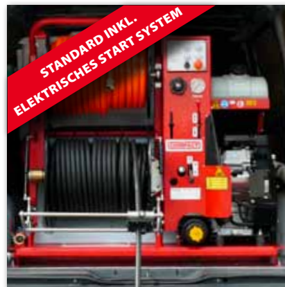
Vorderansicht ROM COMPACT 150/50 Benzin Ausführung