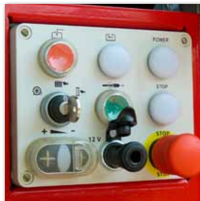
Benutzerfreundlich wasserabstoßend Armaturenbrett