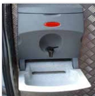
Mobile heiswasser Handwascheinheit