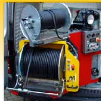
2. HD Haspel