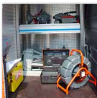
Werkzeugkasten aus Aluminium