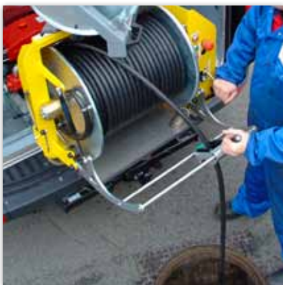
Schwenkbare Haspelwanne aus Edelstahl