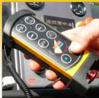
Mehrere hydraulisch gesteuerte Funkfernsteuerungen