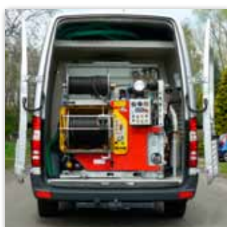
Lackierung in einer Ihrer Firmen- bzw. Kommunalfarben