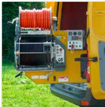
Schwenkbare Steuereinheit in hochglanzgespritzter grauer Metallic-Lackierung (RAL 9023)