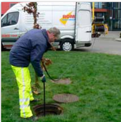
Vollständig hydraulisch bedienbare 270° drehbare HD Haspel

** Wahl des Tankinhalts: 600, 800, 1000, 1200, 1350, 1600, 1800, 2000 und 2700 Liter.