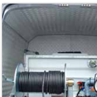
Alu-Riffelblech Verkleidung von Maschinerium