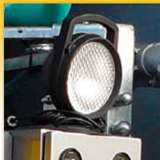
Arbeitslampe mit Magnetfuß