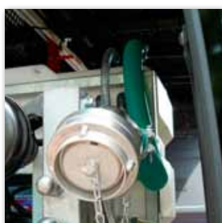
Feuerwehrcupplung Typ "C"