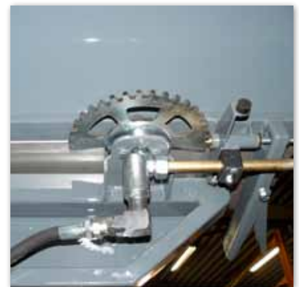
Stufenlos einstellbarer Verschlussmechanismus in jeder Position des hydraulisch bedienbaren HD-Haspels