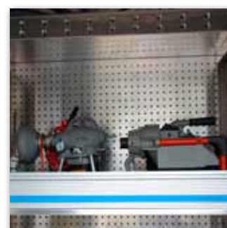
Werkzeugkasten aus Aluminium (Obenansicht)