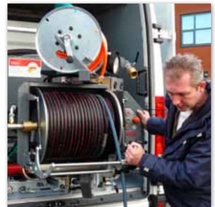
Schwenkbares Bedienungspanel, standardmäßig in basaltgrau gespritzt (RAL 7012)