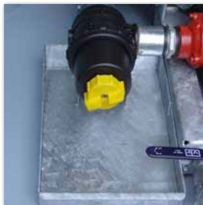
Automatisch schließender 2" Wasserfilter