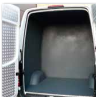
PU lining; Innenverkleidungsoption